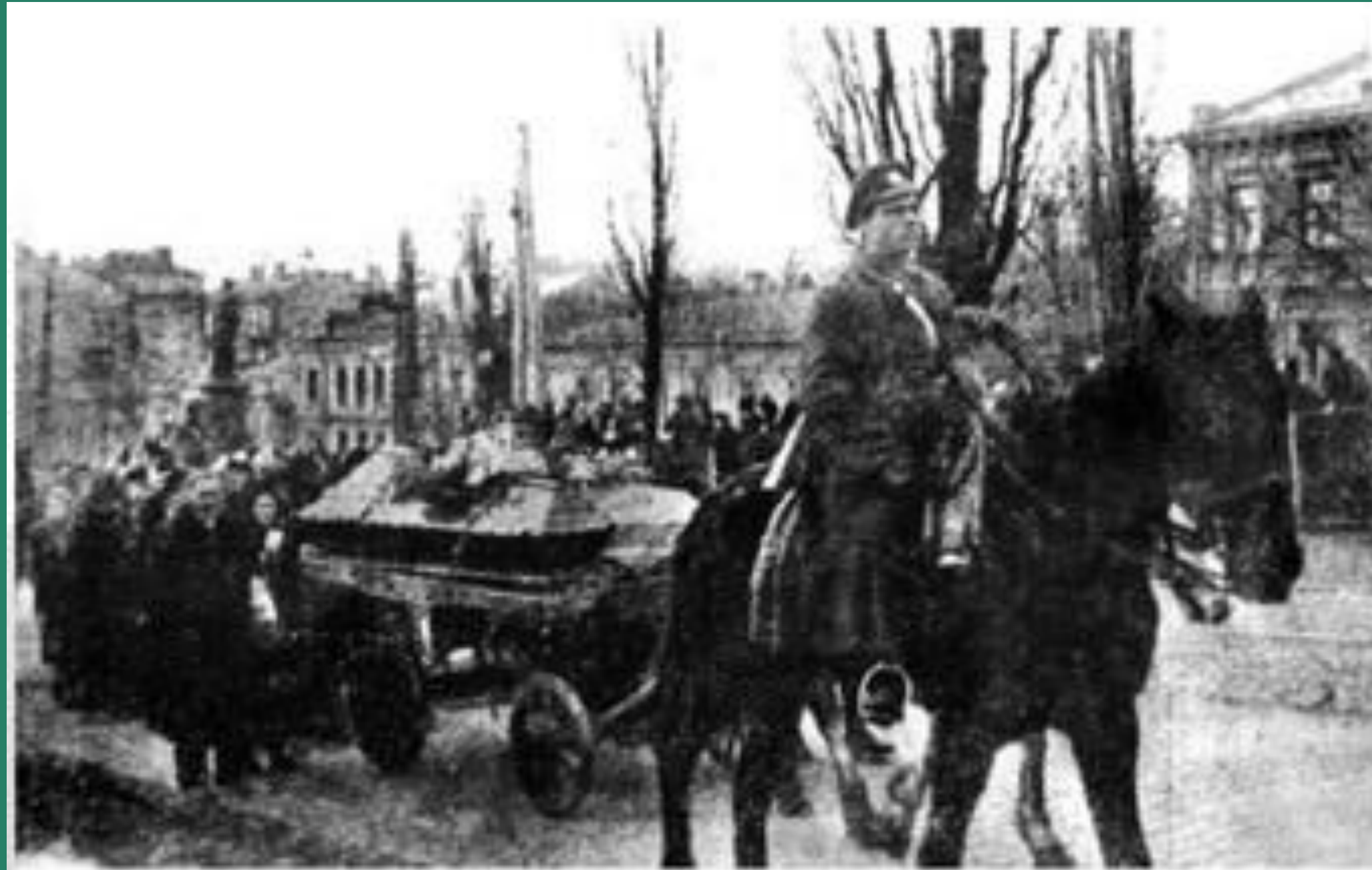
Фрагмент похоронної ходи вулицями Києва. Київ, 10 (23) березня 1918 р.

На похороні в Києві біля Аскольдової могили голова Української Центральної ради Михайло Грушевський назвав юнаків, які загинули в нерівній боротьбі