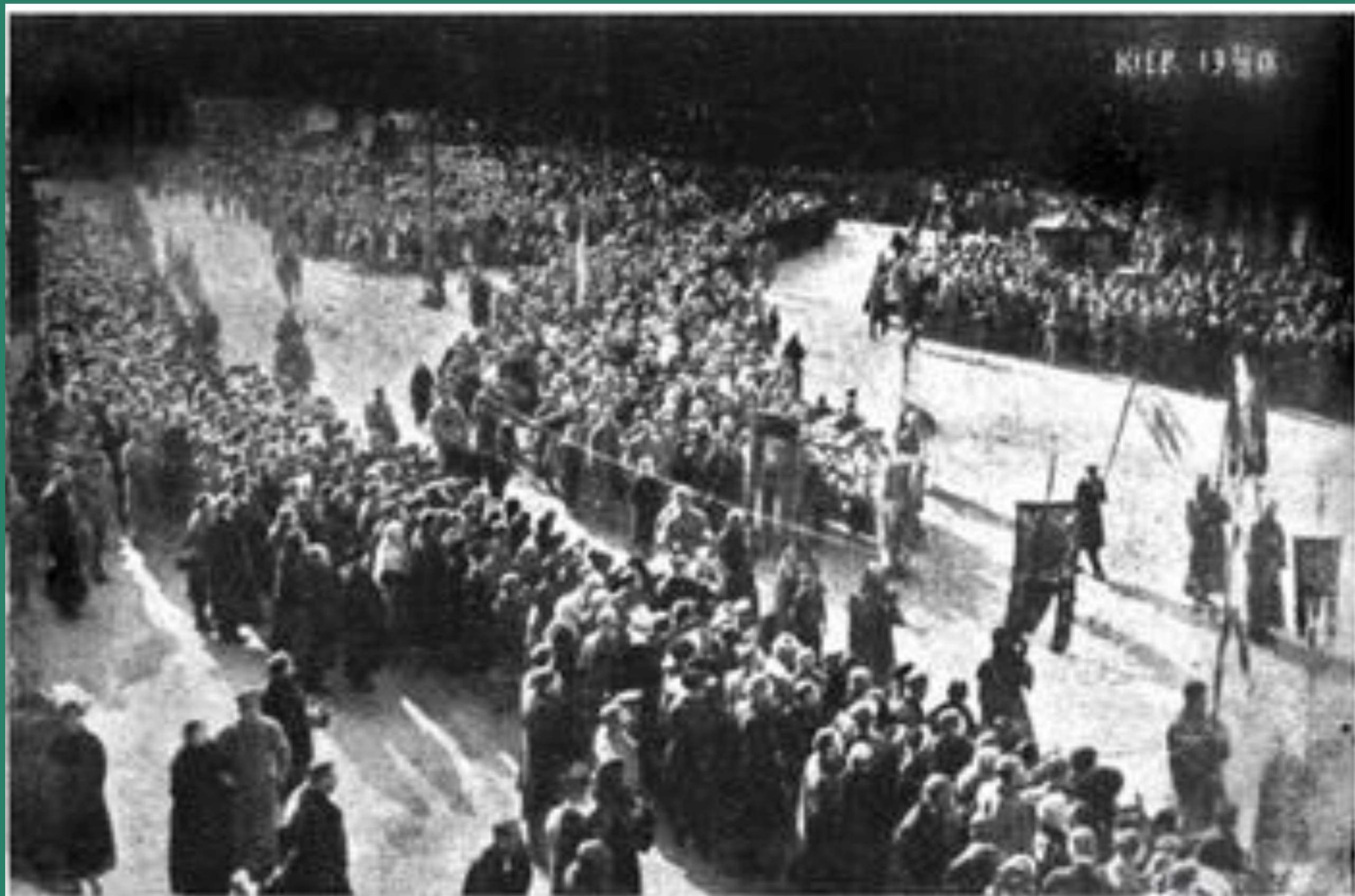
Перепоховання загиблих героїв Крут. Київ, 10 (23) березня 1918 р.