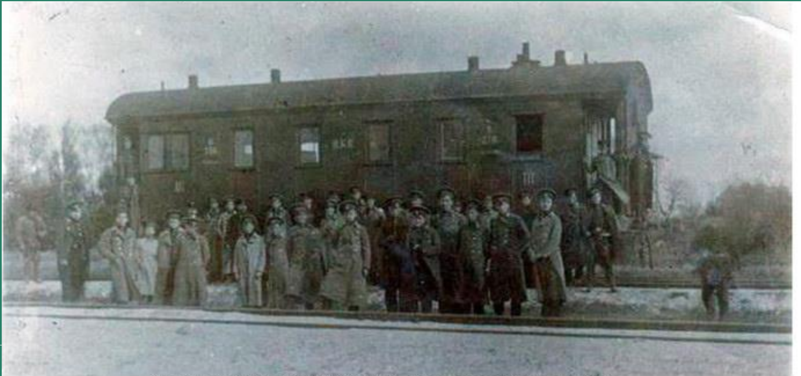
Студенти на станції Крути, фото незадовго до бою

Озброєння катастрофічно бракувало – загін мав лише 16 кулеметів, невеликий бронепоїзд та обмаль патронів.