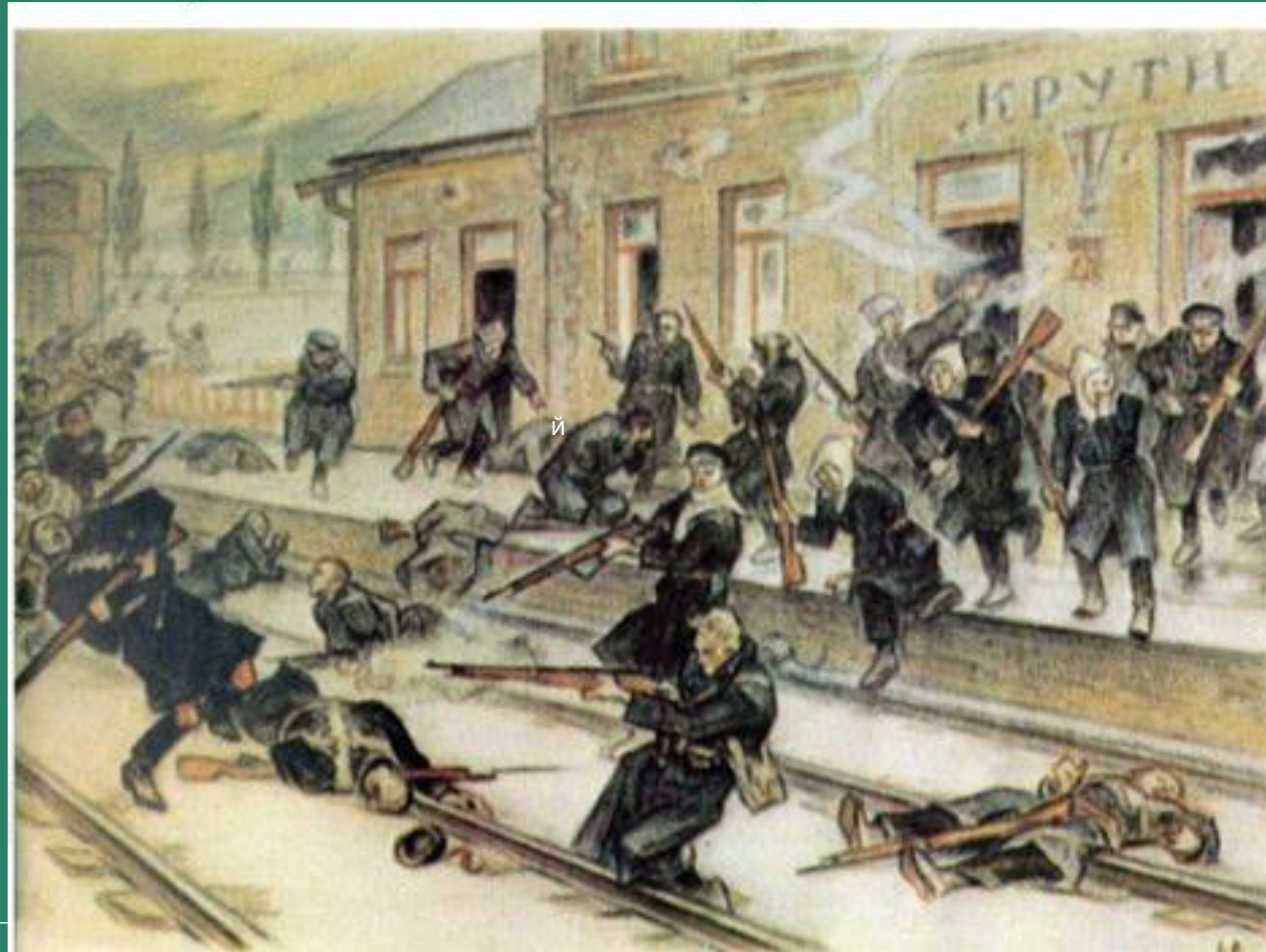
Картина Леонід Перфецький « Бій під Крутами »

Цей бій тривав 5 годин. З боку більшовиків - кілька тисячний підрозділ російської Червоної гвардії під керуванням Михайла Муравйова .