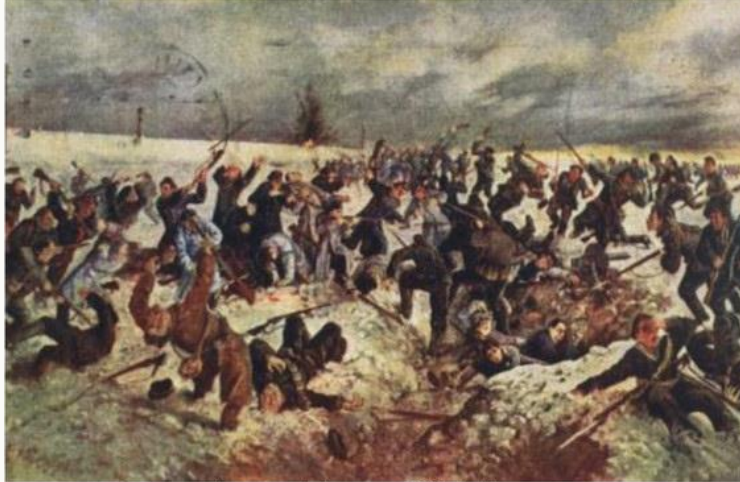
Картина А.Климко «Бій під Крутами»

В Україні 29 січня відзначається як День пам'яті Героїв Крут - однієї з трагічних і водночас високо легендарних сторінок в історії української визвольної боротьби 1917- 1921рр.